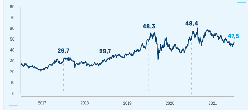
Динамика капитализации (млрд долл. США)